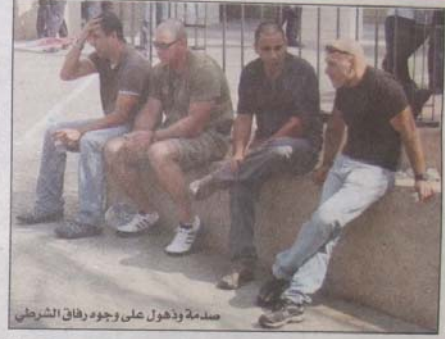
سدمة وذهول على وجود رفاق الشرطي

الشهريين من عمرها فقد عثرت عليها الشرطة في غرفة الوالدين وقد أطلق عليها الرصاص . أفاد رجال الإسعاف في نجمة داوود الحمراء الذين استدعوا إلى مكان الحادث بأنه لم يكن في وسعهم فعل أي شيء فقد وصلوا إلى المكان بعدما فارق ابنه العائلة الحياة . تعتقد الشرطة بأن الزوج الذي يعمل شرطياً أطلق النار من مسدسه على أبناء عائلته فقتل أولاً زوجته ثم طفليه الصغيرين وبعدها أطلق النار على نفسه . واكتشفت هذه الحادثة قرابة الساعة ١٠:٢٠ عندما وصل إلى الشقة التي يسكن فيها الشرطي زملاء له في العمل بعدما حاولوا الاتصال به هاتفياً دون جدوى . وجد