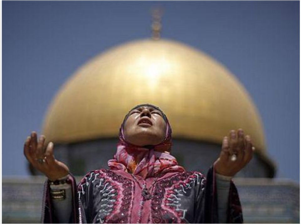
האיסלם משתמש בכלים הדמוקרטיים כדי להתשפט בעולם]